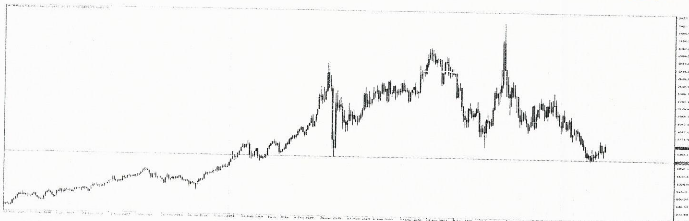
GRAFIKON (tjedni): paladij