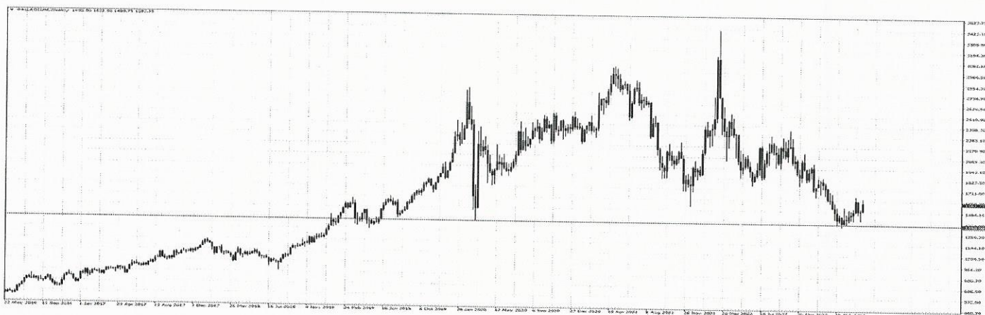
GRAFIKON (tjedni): paladij