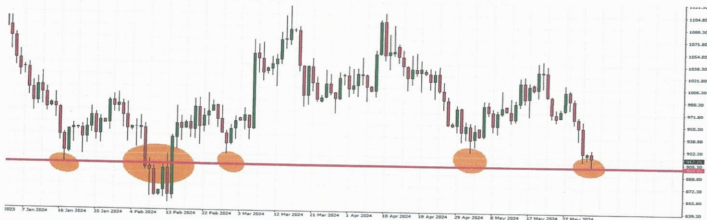
GRAFIKON (dnevni): siječanj-lipanj 2024.